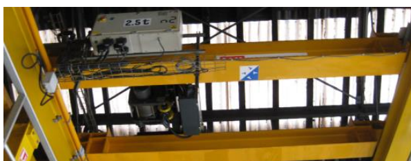
Exemple de pont