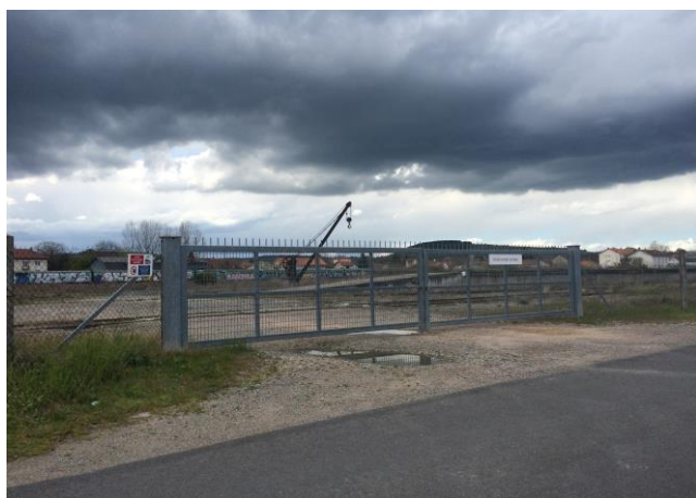
(Entrée nord)